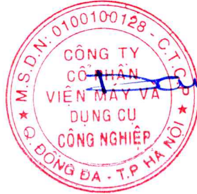
Đặng Duy An - Chủ tịch HĐQT